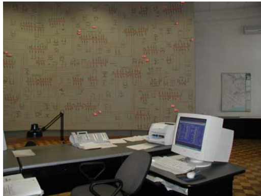
Рабочая станция аппаратной части комплекса АСДУ DMCC на базе DlgSILENT PowerFactory

Внешний интерфейс связи с OPC-сервером базы данных SCADA. Соединение Ethernet LAN, IEE1386, etc.